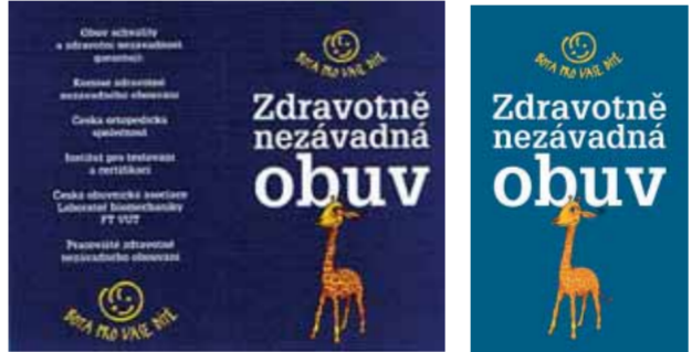
Logo „Žirafa“ společně s visáčkou:

Děti jsou nejvíce zranitelné v období svého vývoje a péče o zdravý vývoj jejich nohou by měla být důležitá nejen pro lékaře a rodiče dětí, ale i pro prodejce dětské obuvi a vůbec pro celou společnost. Dětská noha je pouze částečně osifikovaná a k plné osifikaci dochází teprve mezi 8 a 10 lety věku dítěte. Dítě právě proto, že jeho kosti jsou pouze chrupavčité a má snížený práh citlivosti vůči tlaku a bolesti, není schopno sama posoudit, jak mu obuv padne a zda ho netlačí. Proto konstrukce dětské obuvi musí dodržet určité zásady, které jsou předmětem dobrovolného procesu posouzení. Hovoříme o tzv. minimálních lékařských požadavcích na konstrukci dětské obuvi, které garantují, že se dětská noha bude dobře vyvíjet a nebude deformována špatnou obuví.