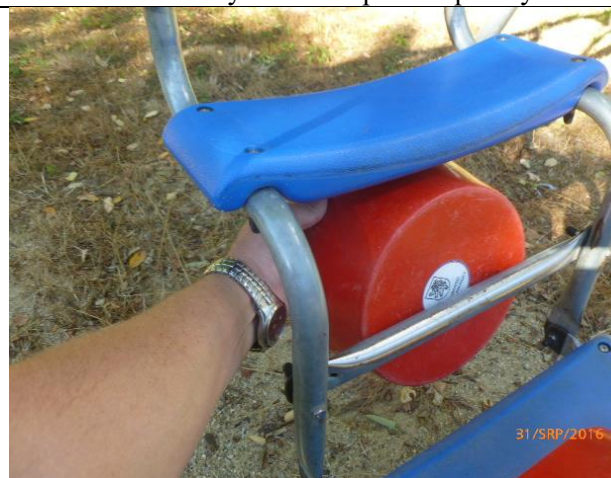
riziko zachycení hlavy v houpacím sedáku