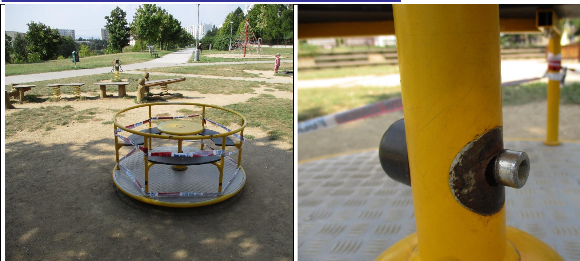
Kolotoč Brno - úraz – zachycení o nezakrytý šroub