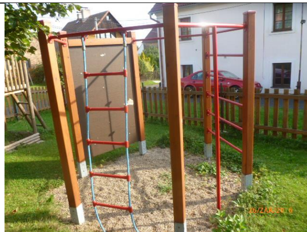
nedostatečný rozsah dopadové plochy