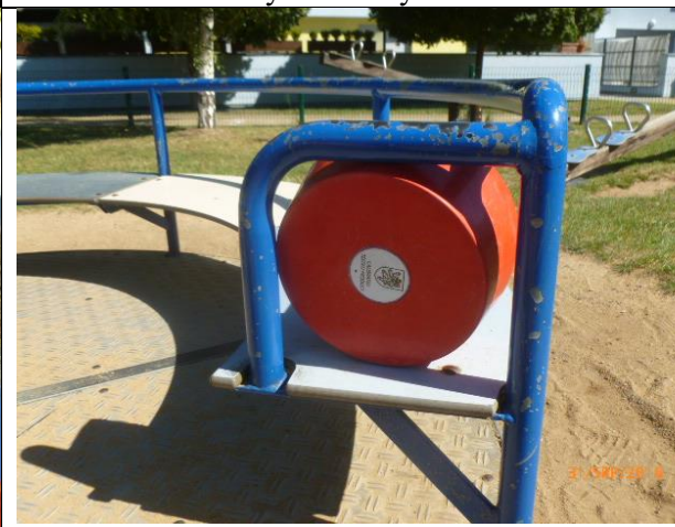
riziko zachycení hlavy na kolotoči