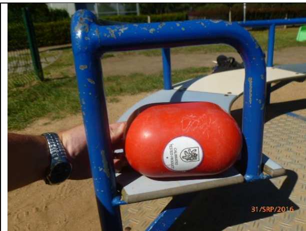
riziko zachycení hlavy na kolotoči